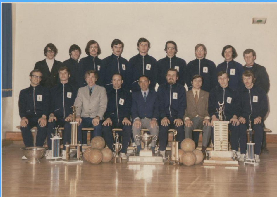
Une photo d'équipe de la Palestre nationale dans les années 70.