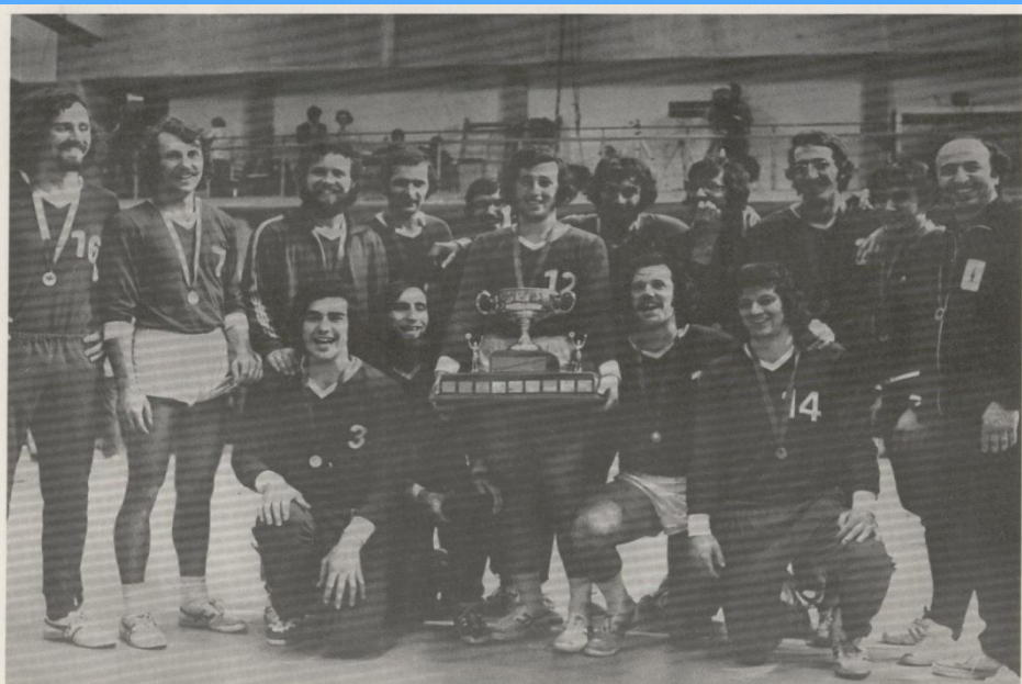
LA PALESTRE NATIONALE CHAMPIONS CANADIENS SENIOR DEPUIS 1971